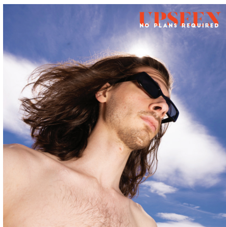
No Plans Required EP - 2020