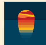
Sold Out Sunset Album - 2016