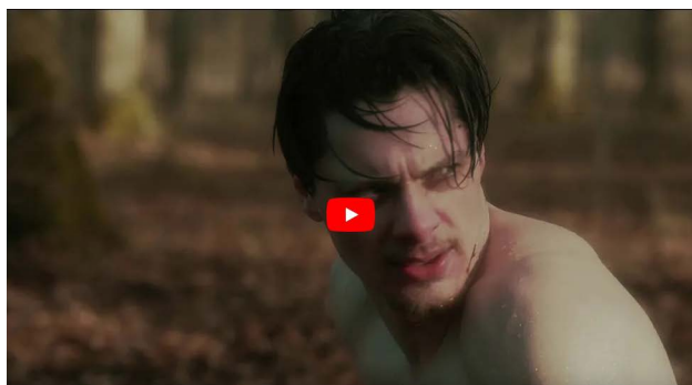
HOSSEC / clip sorti le 2 avril 2021

Ouverture et confinement, ombre et lumière, machine et batterie, Roraïma joue sur desmo comme en live, sur l'ambivalence et la dualité pour livrer une musique brute mais résolument ouverte et addictive.