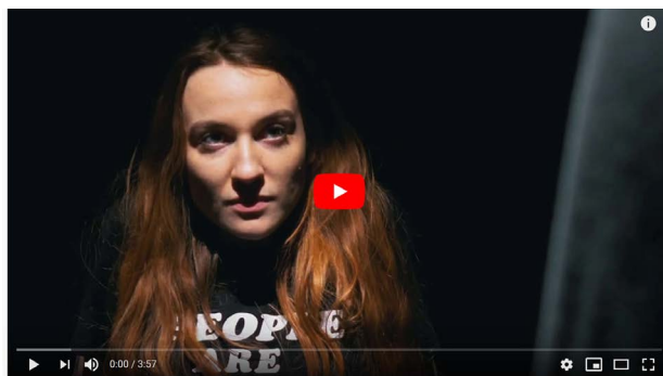
B / clip sorti le 3 avril 2020