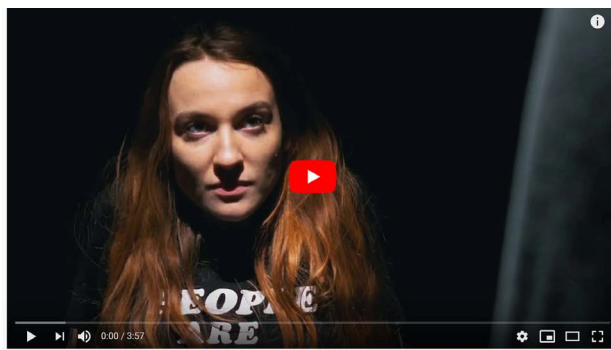
B / clip sorti le 3 avril 2020